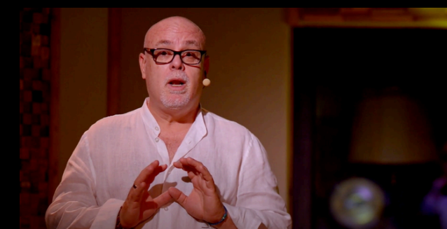
Diminuto poema perteneciente a Canturía