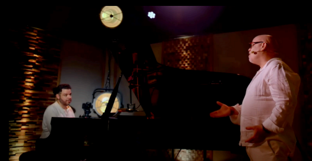
Llegar muy lejos historia para todos los públicos