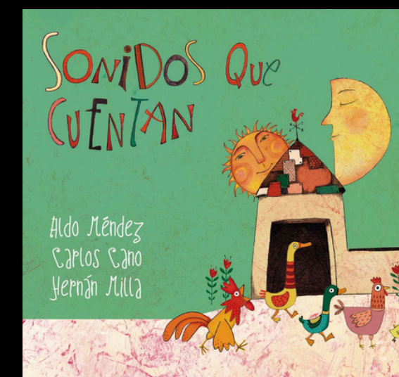
Sonidos que cuentan