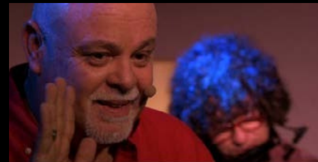
Pollito chiquitito cuento popular para público infantil