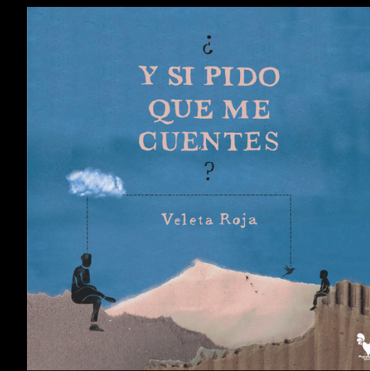
¿Y si pido que me cuentes?